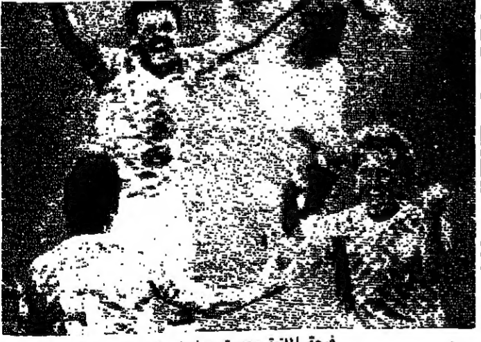
فرحة اللعنة بعد تسجيل الهدف